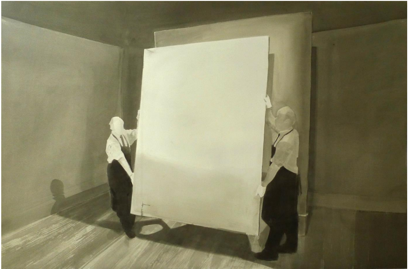
A big picture, 2016, china su carta, 114x 158cm.