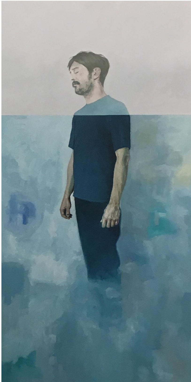
Riccardo, 2017,200x100cm, olio su tela.